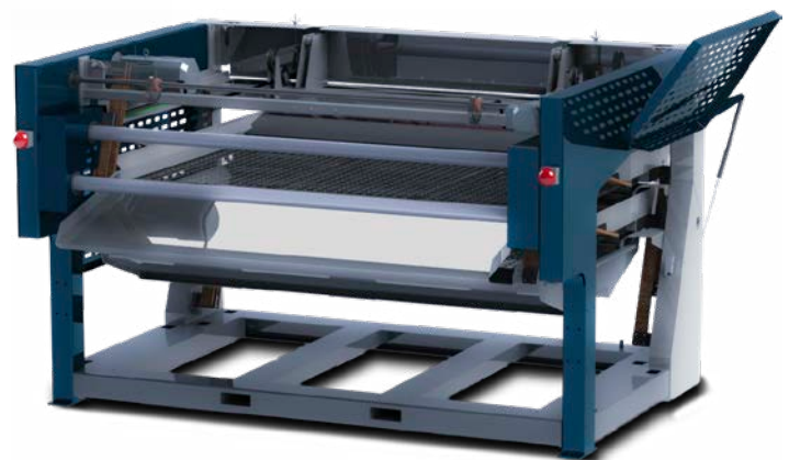
Sortierer GRADE 1300