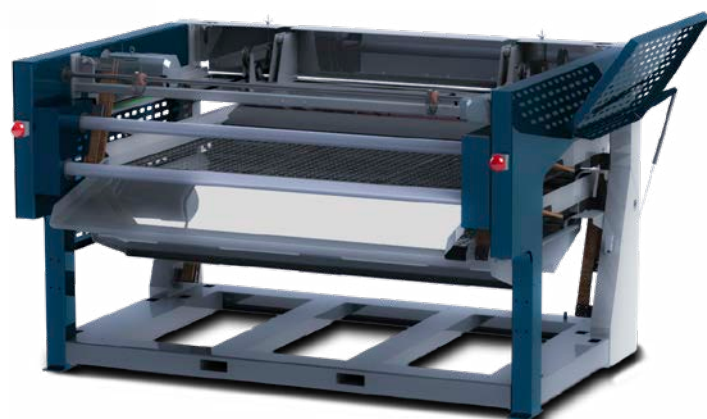
Sortermachine GRADE 1300